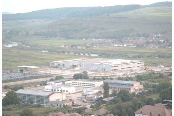
Idyllisch gelegen - das neue Werk von Bosch-Rexroth in Blaj.