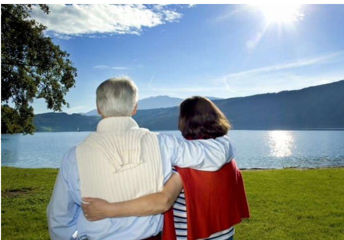
Gemeinsam und gesund den Ruhestand genießen, das wünschen wir uns doch alle.

Ausnahme: Versicherte mit 45 Pflichtbeitragsjahren können bereits mit 65 Jahren in die Rente.