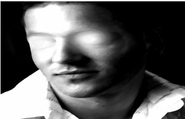
Graue Mäuschen: Blinde Gefolgschaft, ihre einzige Chance ?

Fast täglich gehen sie durch die Medien, die Meldungen von gewalttätigen, Naziübergriffen. Diese Erscheinungen sind jedoch keine reine Männer-sache ! Immer mehr Mädchen und Frauen versuchen ihren Vorbilder nachzueifern. Sie vergleichen sich mit einer Henriette von Schirchach, einer Magda Goebbels oder einer Emmy Göring. Sie bleiben aber nur was sie sind - kleine graue Mäuschen.